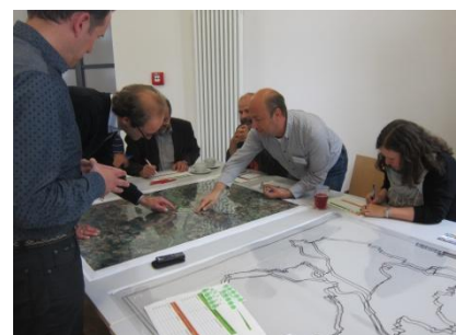
Wie hat sich unsere Region über die Jahre verändert?