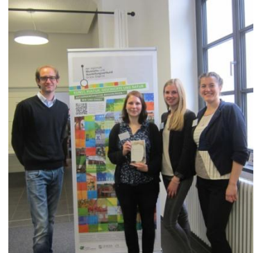
Teile der Autorenschaft des Landschaftskrimis

Illegal gegrabene Erdlöcher und ein attackierter Jogger beschäftigen die Menschen der Griesen Gegend. Kommissar Benjamin Pietsch und die Mitarbeiter der Naturschutzbehörde Jörg Nussbaum und Annika Mewandowski untersuchen den Fall. Auf der Suche nach dem Täter erfährt der Leser viel Wissenswertes über die Griese Gegend und den Naturschutz.