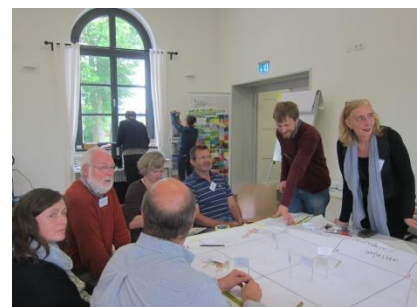
Was macht eine Kulturlandschaft eigentlich aus?